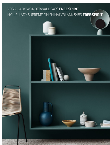
VEGG: LADY WONDERWALL 5489 FREE SPIRIT HYLLE: LADY SUPREME FINISH HALVBANK 5489 FREE SPIRIT