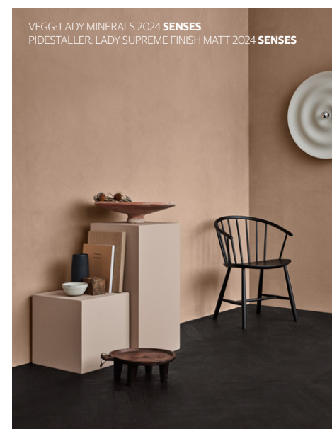
VEGG: LADY MINERALS 2024 SENSES PIDESTALLER: LADY SUPREME FINISH MATT 2024 SENSES