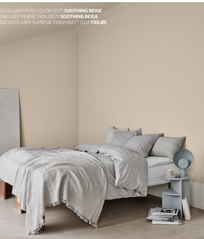
VEGG: LADY PURE COLOR 12075 SOOTHING BEIGE TAK: LADY PERFECTION 12075 SOOTHING BEIGE GULVLIST: LADY SUPREME FINISH MATT 1024 TIDLØS

Et enkelt spørsmål om bruken av rommet, kan gi deg en liten pekepinn på hvilke farger som er rett for deg.