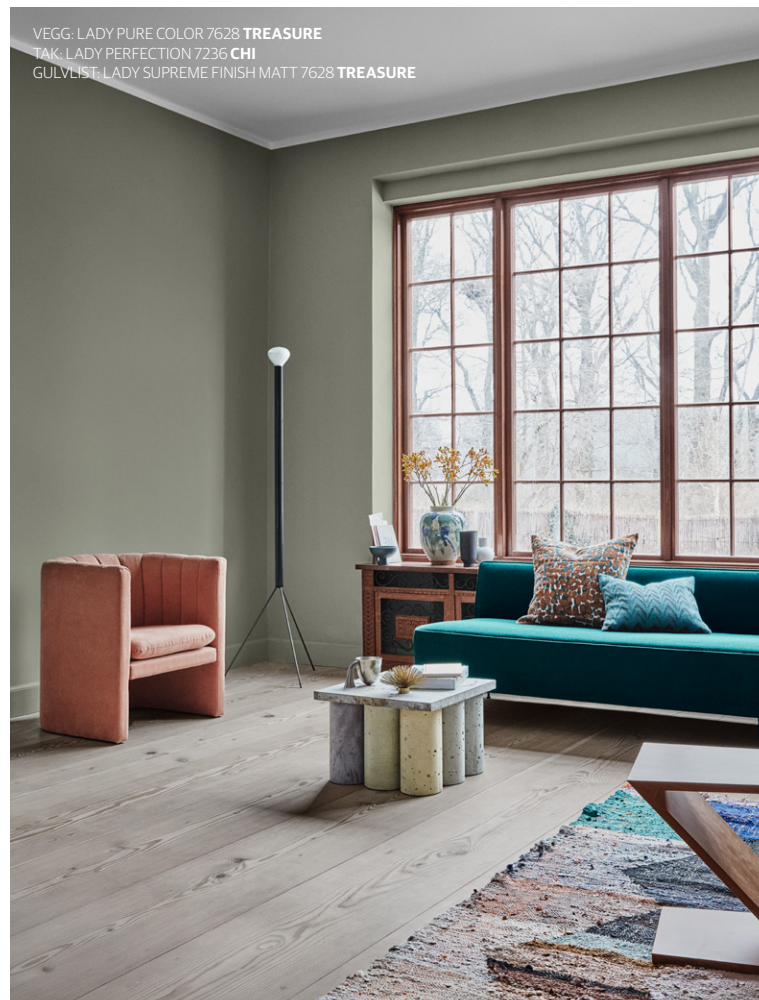
VEGG: LADY PURE COLOR 7628 TREASURE TAK: LADY PERFECTION 7236 CHI GULVLIST: LADY SUPREME FINISH MATT 7628 TREASURE

Kombinasjon av ulike glansgrader skaper et lekkert interiør. En supermatt vegg malt med LADY Pure Color og detaljer malt med LADY Supreme Finish Superblank eller Halvblank, tilfører rommet spennende og elegante kontraster.